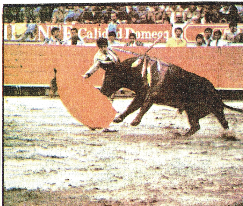
Esplendoroso estuvo el «Niño de la Capea» en la corrida del 12 de enero.

Dos puntos que tengo que tocar en este resumen son que a pesar de las escuelas taurinas no se ha formado ningún torero, tal vez por falta de vocación. Por otra parte no se pueden organizar grandes carteles con los mejores espadas que lo mismo pueden lidiar un corridón que una becerrada.