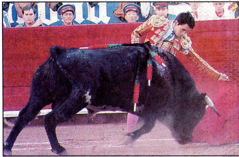
Fotos: Novedades EL ZOTOLUCO , único que da la cara por la fiesta brava mexicana en el extranjero