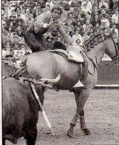
EL CONSIDERADO mejor rejoneador del mundo desmonta tras colocar las banderillas.

guió lo mejor de la tarde clavando cortas en todo lo alto y ejecutando el teléfono. Mató con el rejón en todo lo alto y de inmediato Pablo descendió de su caballo pero el toro tardó en doblar requiriendo de tres descabellos.